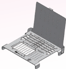
ø1.5 ソフィアロッキングパレット (SL15-023)